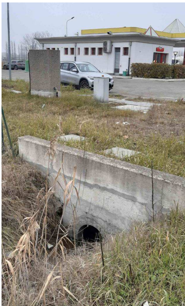
Fotografia 7 – Fosso stradale, lato sud