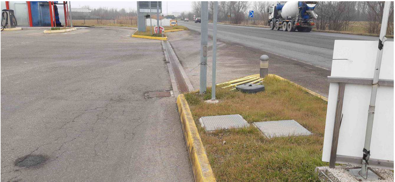
Fotografia 2 – Zona ingresso a stazione di servizio