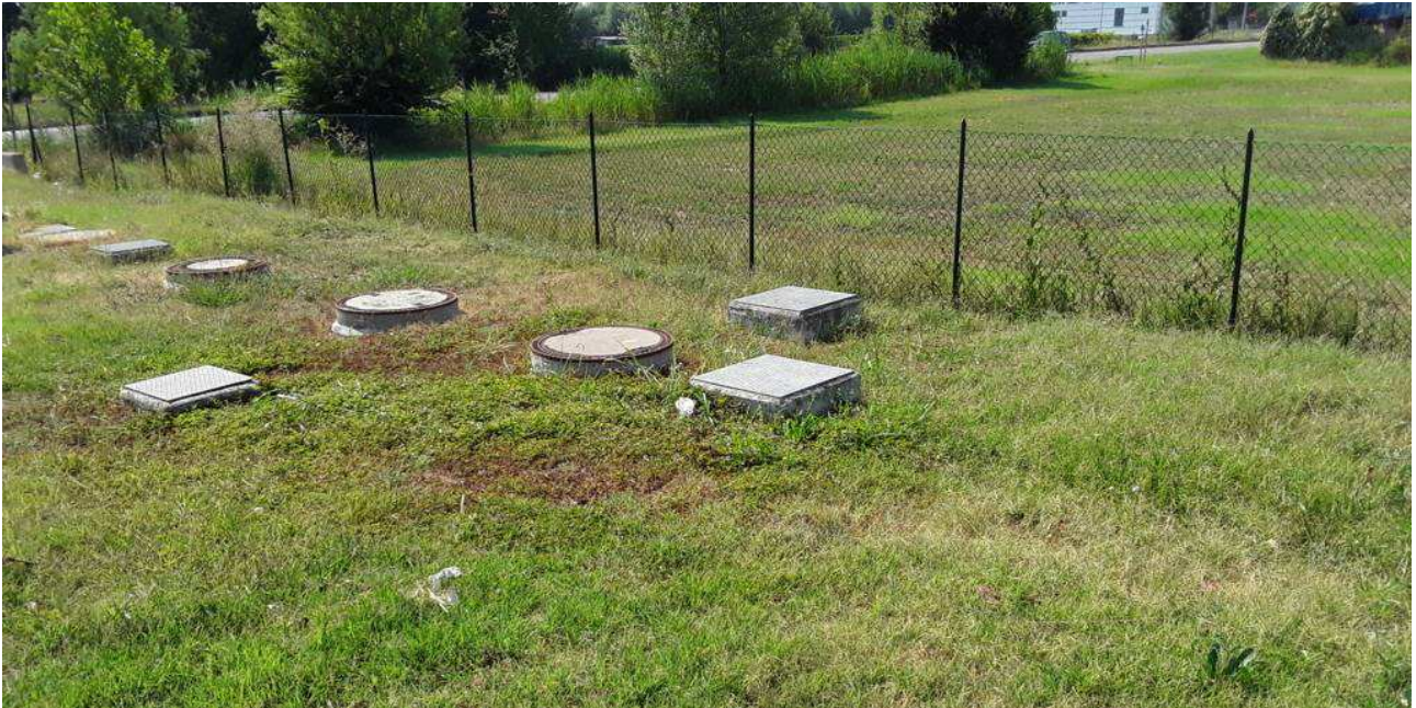
Fotografia 1 – Impianto di trattamento acque di prima pioggia