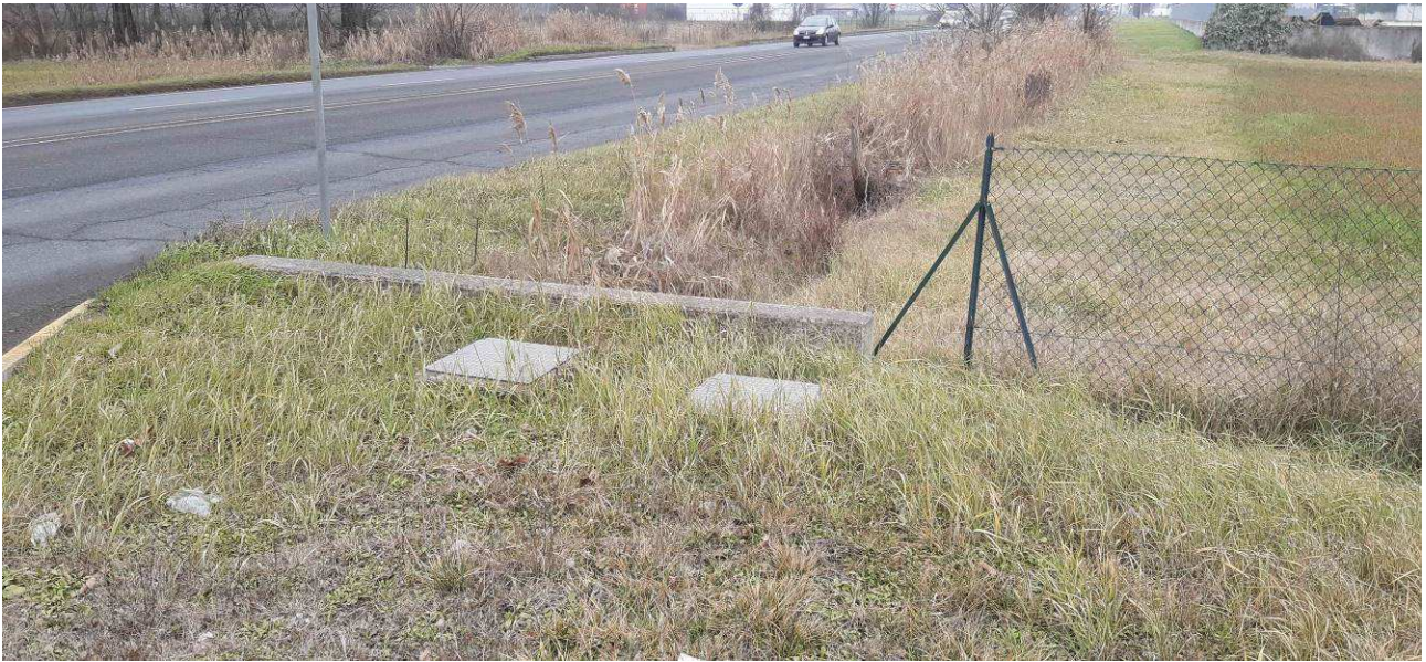
Fotografia 5 – Pozzetti acque bianche e di immissione in fosso stradale