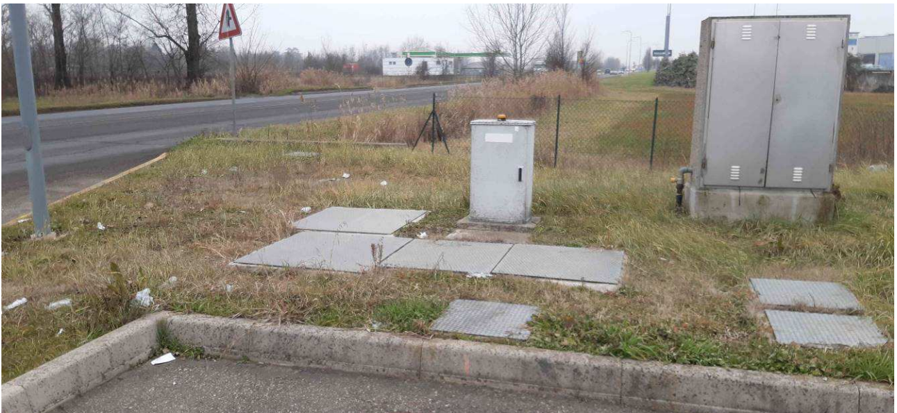
Fotografia 4 – Zona vasca di sollevamento e invio reflui a pubblica fognatura