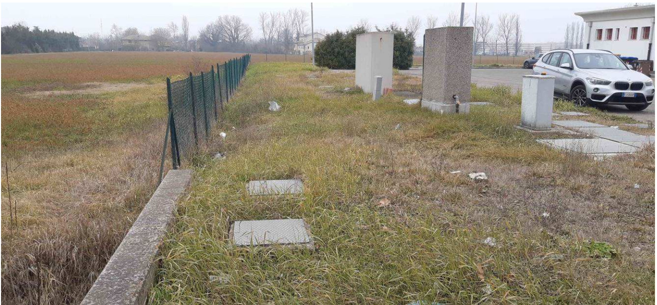
Fotografia 6 – Pozzetti acque bianche e di immissione in fosso stradale