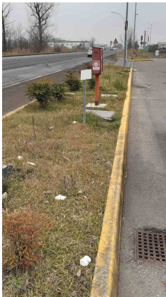
Fotografia 8 – Aiuola spartitraffico