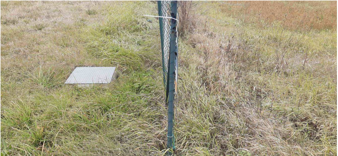
Fotografia 3 – Immissione in fosso tombinato, a nord