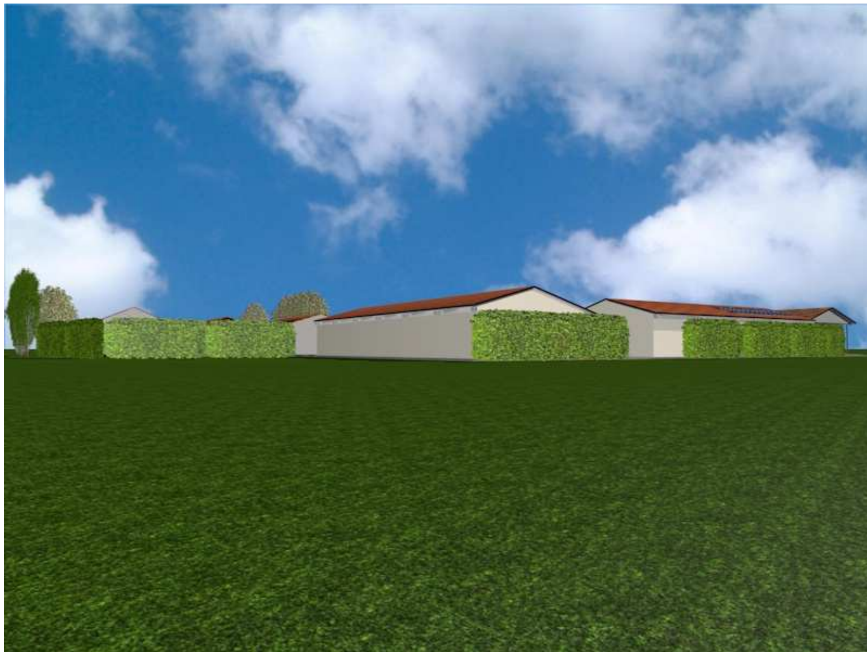
Vista da sud Ovest di progetto