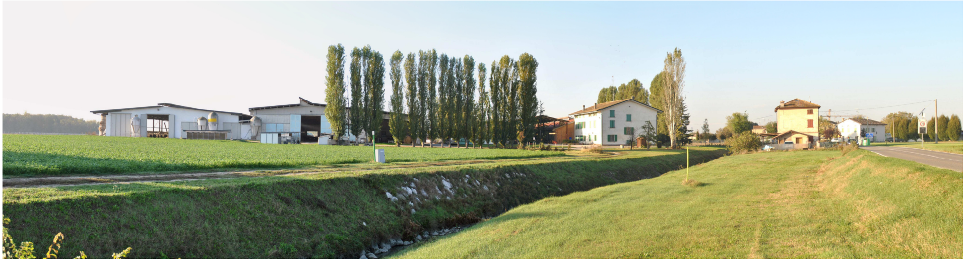
Vista panoramica da Nord Ovest stato attuale con, in primo piano, il Bene Paesaggistico tutelato.