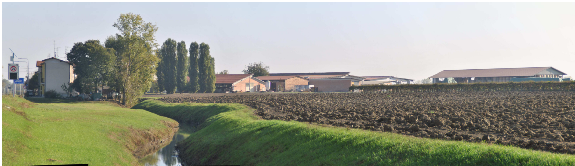
Vista panoramica da Sud Ovest dello stato attuale con, in primo piano, il Bene Paesaggistico tutelato